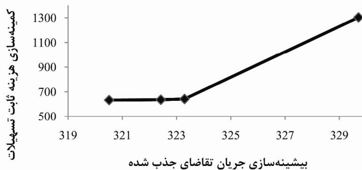
نمودار ۲. جواب‌های ناچیره مدل برنامه‌ریزی آرمانی وزن داده شده پیشنهادی

* نرم‌افزار پس از مدت ۳۶۰۰ ثانیه به جواب مذکور (با فاصله ۳/۳۷۱٪ از کران پایین محاسبه شده) رسید.