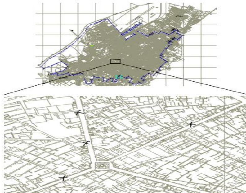
شکل ۳. نقشه شهر یزد و یک برش کوچک از آن شامل موقعیت مکانی مشتریان این محدوده

اجرا شد، که در تمام اجراها زمان رسیدن به جواب کمتر از ۸ دقیقه بود. جواب‌های بدست آمده از روش پیشنهادی با اطلاعات موجود از روش کنونی در جدول ۲ مقایسه شده است. روش معرفی شده موجب بهبود در مسافت کل حمل و نقل، و کاهش