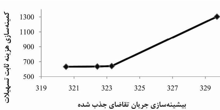
نمودار ۲. جواب‌های ناچیره مدل برنامه‌ریزی آرمانی وزن داده شده پیشنهادی

* نرم‌افزار پس از مدت ۳۶۰۰ ثانیه به جواب مذکور (با فاصله ۳/۳۷۱٪ از کران پایین محاسبه شده) رسید.