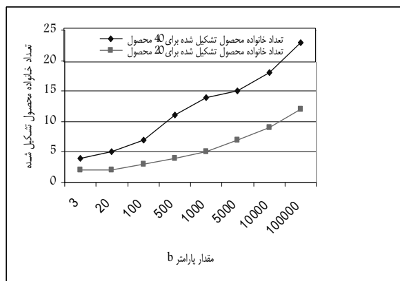
شکل ۳. تاثیر پارامتر b بر تعداد خانواده محصول