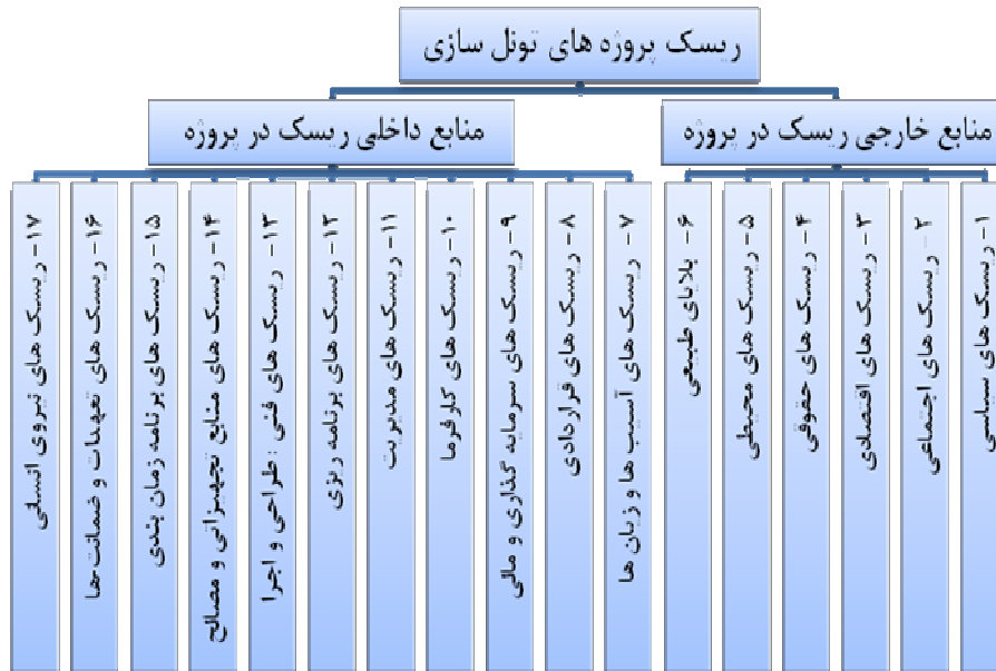
شکل ۱. ساختار شکست ریسک پروژه‌های تونل‌سازی (۱۷ ریسک اصلی)