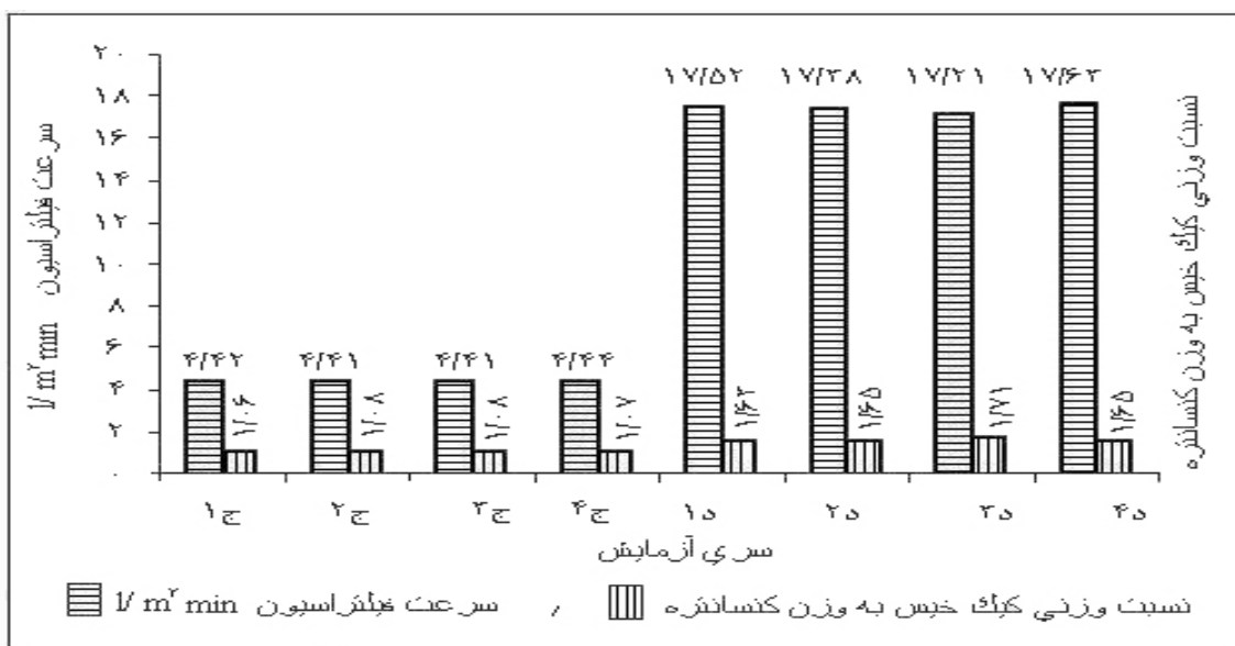
شکل ۲. نتایج حاصل از آزمایش های سری ج و د بر روی نمونه دوم