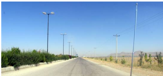
شکل ۳. کاهش ادراک جزئیات منظر در اثر افزایش سرعت حرکت، محور ورودی شهرکرد