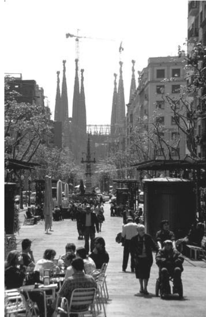
شکل ۴. توجه به کیفیت طراحی معبر براساس توجه به نیاز عابری، بارسلونا