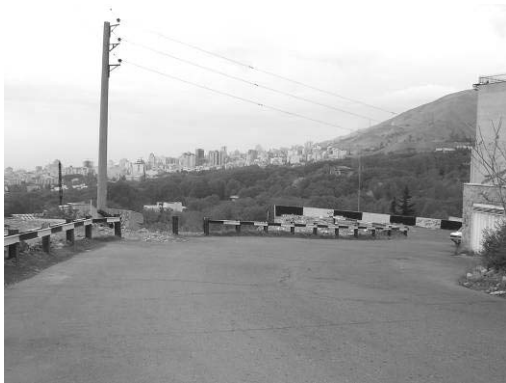
شکل ۵. تقویت دید و منظر توسط تغییر جهت و انحنای مسیر، محله باغ شاطر دربند، تهران