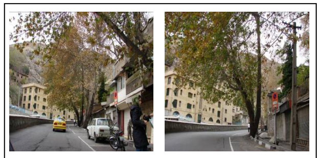
شکل ۱. دیدهای پی در پی و ایجاد مناظر جدید، خیابان دربند تهران