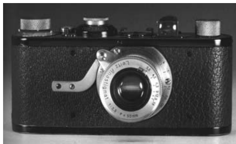
شکل ۱. دوربین Leica به رنگ قهوه‌ای، طراح Oskar Barnack، ۱۹۱۳. [Ibid. p. 27]

از لحاظ تاریخی نمی‌توان به رابطه مهم و اساسی بین رنگ و طراحی صنعتی، مگر در چند دهه اخیر، دست پیدا نمود. با رجوع به وضعیت صنایع در اوایل قرن بیستم میلادی و مطالعه تاریخی این دوره، در می‌یابیم تا چه حد طراحی صنعتی در تعیین رنگ محصولات ناتوان بوده است (اشکال ۱ تا ۵). دلایل مختلفی بر این امر دلالت دارند: