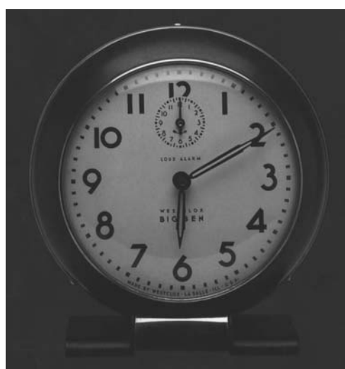
شکل ۵. ساعت زنگدار رومی‌زی "بیگ بن" به رنگ سیاه، طراح Henry Dreyfuss، ۱۹۳۹. [Ibid.]