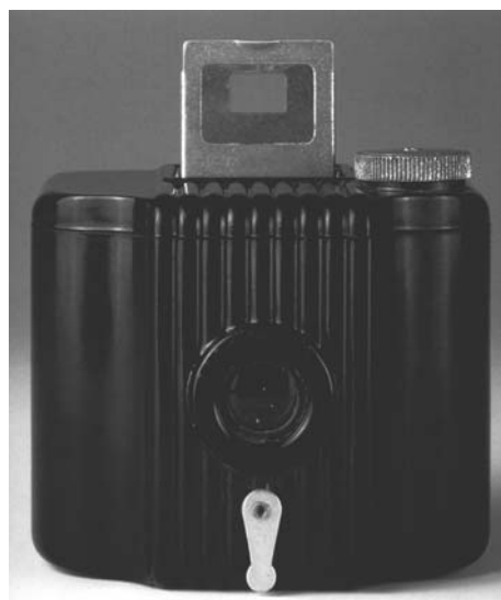
شکل ۳. دوربین کداک به رنگ قهوه‌ای، طراح Walter Dorwin Teague، ۱۹۳۴. [۱۴]

وی ادامه می‌دهد که "کاربرد رنگ در طراحی صنعتی از این قاعده مستثنی نبوده است. در واقع، عامل باور و عقیده جامعه، استفاده متنوع از رنگ‌های چشمگیر را محدود می‌کرده است. این عقیده و