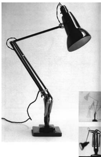
شکل ۲. چراغ مطالعه به رنگ سیاه، طراح George Carwardine، ۱۹۳۲. [Ibid. p. 52]