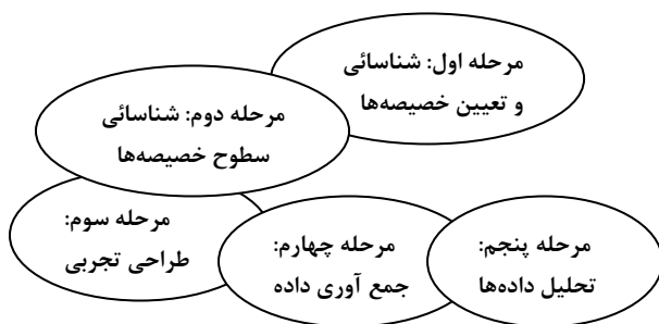
نمودار ۲. مراحل روش انتخاب تجربی ۱

Hanley, Mourato and Wright در سال ۲۰۰۱ بحث مفصلی از این روش را ارائه دادند. آنها مراحل این روش را به صورت نمودار ۲ در قالب ۵ مرحله بیان کردند [۱۴].