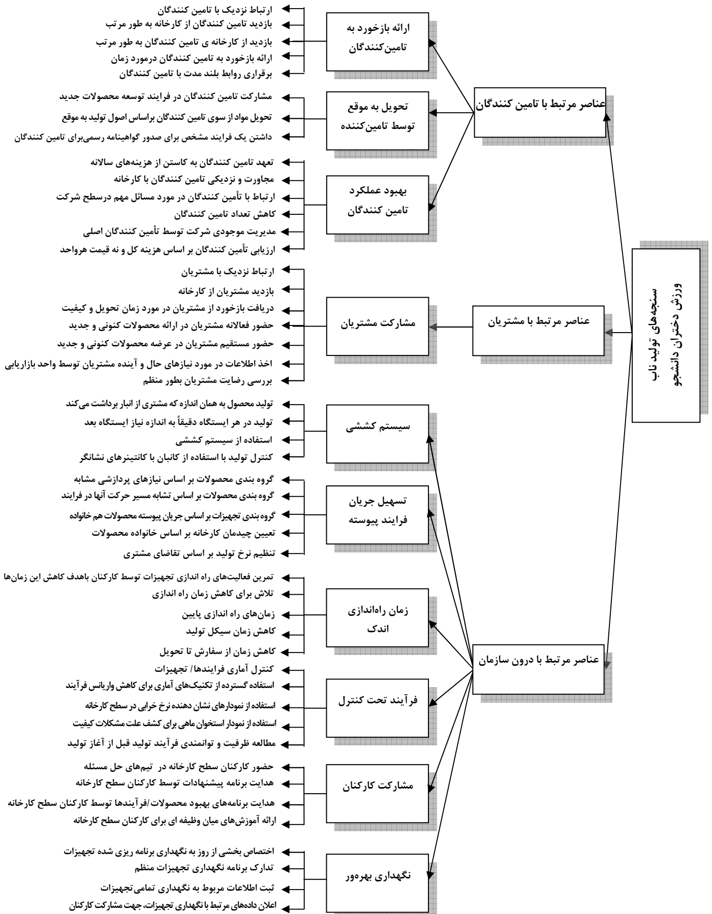
نمودار ۱. درخت سلسله مراتب سنجه‌های تولید ناب