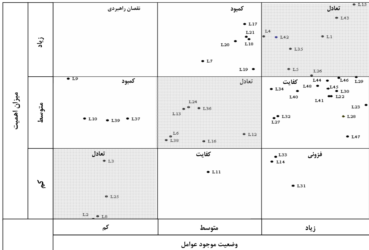
شکل ۱. ماتریس آسیب شناسی عناصر نابی در صنعت کاشی